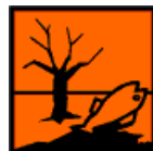
nebezpečný pro životní prostředí